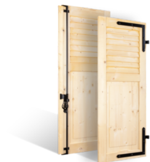
VOLETS BATTANTS 32mm À LAMES JOINTIVES AU TIERS EN BOIS EN SAVOIR PLUS