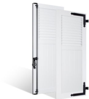
VOLETS BATTANTS 36mm À LAMES JOINTIVES AU TIERS EN PVC EN SAVOIR PLUS