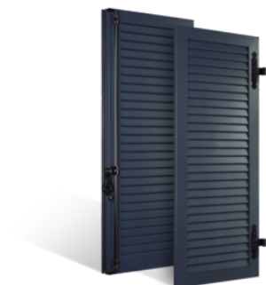
VOLETS BATTANTS 33mm À LAMES JOINTIVES EN ALUMINIUM EN SAVOIR PLUS