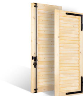
VOLETS BATTANTS 32mm À LAMES JOINTIVES EN BOIS EN SAVOIR PLUS