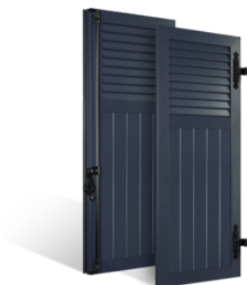
VOLETS BATTANTS 33mm À LAMES JOINTIVES AU TIERS EN ALUMINIUM EN SAVOIR PLUS